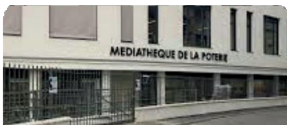
Le stage a lieu la Médiathèque de la Poterie 10 allée Jean-Baptiste Lully 92150 SURESNES

Supports pédagogiques : cours en vidéoprojecteur, exercices sur papier, échiquiers en bois, pendules électroniques, cahier du stagiaire.