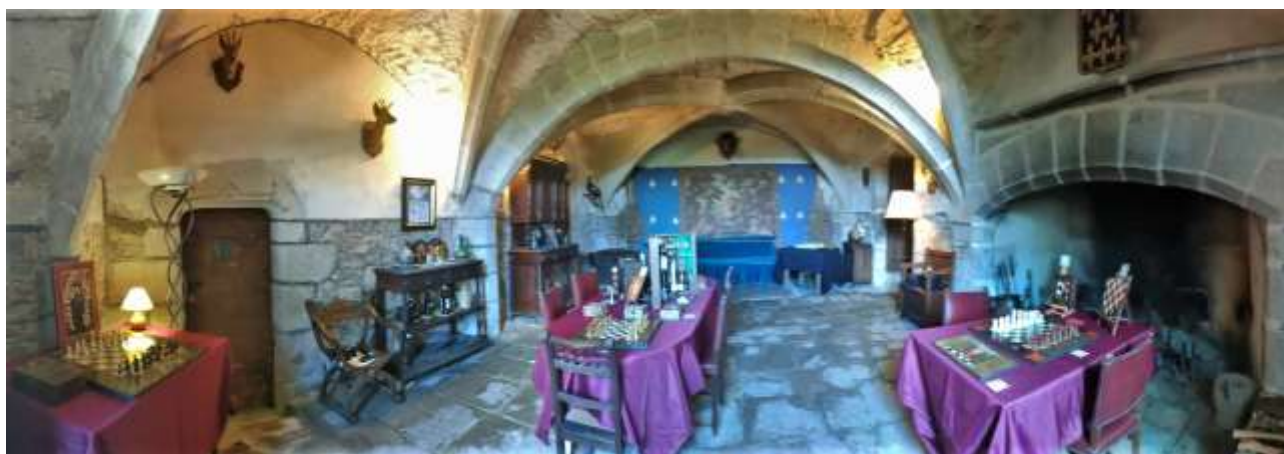
Exposition « Le jeu d'échecs au Moyen Âge » à St Bonnet le Chastel (63)