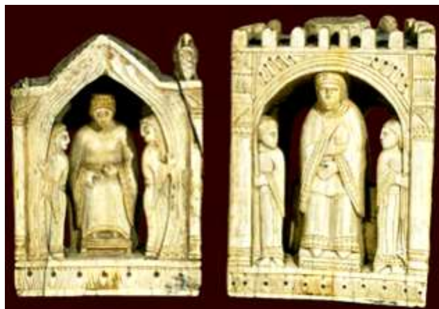
Jeu d'échecs dit "de Charlemagne". Italie méridionale, fin du XI ème siècle. Ivoire