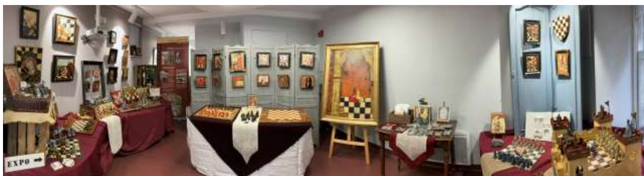
Exposition « Le jeu d'échecs au Moyen Âge » à Billom (63)