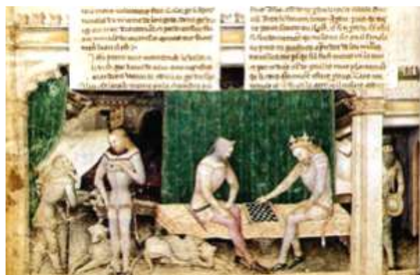
Le roi Arthur affronte Bédouier aux échecs Rusticien de Pise, Guiron le Courtois . Manuscrit copié et peint à Milan, vers 1370