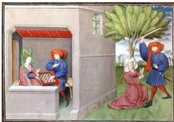
Boccace, Décameron . 1432.

La marche médiévale du jeu apparaît comme l'esquisse des règles contemporaines. Elle se caractérise essentiellement par la limitation des déplacements. L'accroissement de la mobilité des pièces constituera une grande révolution pour les échecs à la Renaissance. L'évolution des règles vise à accélérer les parties, souvent jugées trop lentes et ennuyeuses, notamment en ouverture.