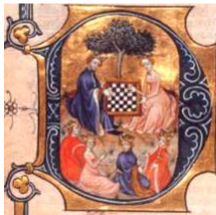
Famille royale jouant aux échecs, enluminure de Dirk de Delft vers 1400