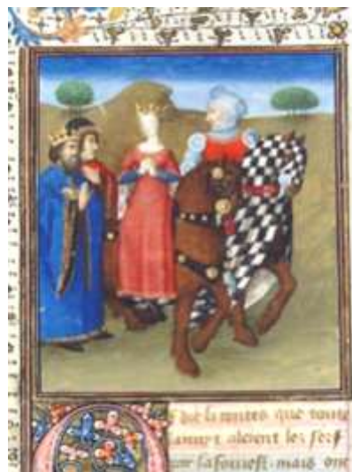
Palamède, chevalier échiqueté du Roman de Tristan (achevé en 1463)