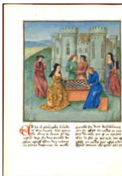
Jacques de Cessoles, Le Jeu des échecs moralisés . Manuscrit interpolé composé des traductions françaises de Jean Ferron et de Jean de Vignay. (début XIV ème siècle)