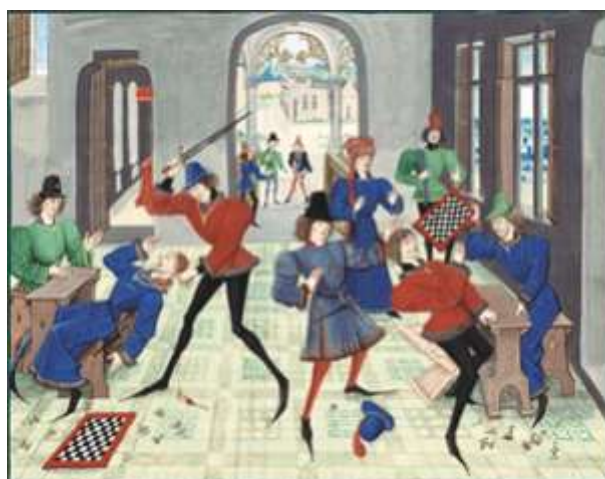
Renaut de Montauban Manuscrit copié et peint à Bruges vers 1462-1470 Partie d'échecs dégénérant en assassinat