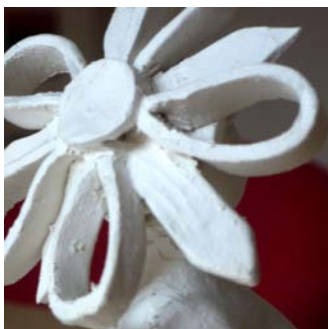
Charline Montagné Ensemble de pièces en porcelaine blanche émaillée détail du travail en cours de réalisation