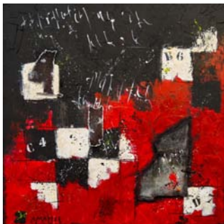
Serge Amarger Le cavalier errant acrylique 50x50

« ...le rouge sombre et le noir laissent entrevoir des portes de lumière... les cases blanches. Cette partie d'échecs est une poésie de la vie. » détail du texte qui accompagne