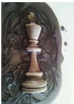
Marge Herrero Le Roi de Marge Roi encadré 39x49 bois résine détail