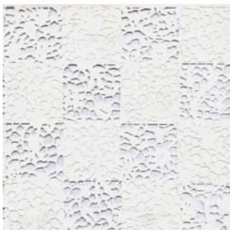
Annie Bascoul L'échiquier de l'amour 1 série l'amour 30 x 30 papier Canson découpé, gaufrage, technique mixte détail