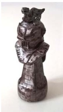
Serge Raoux Le Roi de Fer sculpture en buis, teintée de brou de noix, pigments naturels, cire à dorer 10cm

« ...le rouge sombre et le noir laissent entrevoir des portes de lumière... les cases blanches. Cette partie d'échecs est une poésie de la vie. » détail du texte qui accompagne