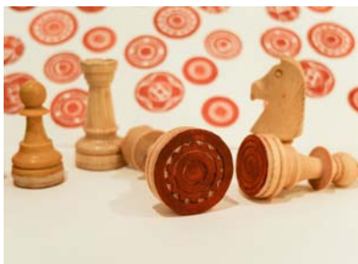
Charlotte Hubschwerlin Hors de l'échiquier, la danse des pièces en liberté Installation composée de plusieurs créations tampons et estampes détail