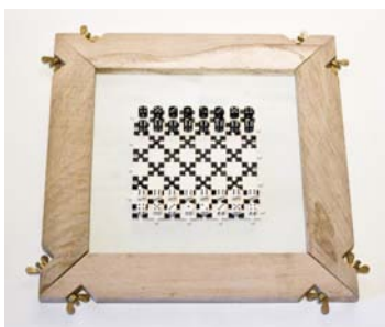
Jérôme Pierre Destin stratégique du hasard pièce de puzzle en carton, dés en résine, verre, chêne, laiton 40cm/40cm/2cm avec changement de titre annuel qui reflète un « perpétuellement en cours »