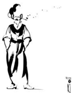
BOLL Autoportrait de BOLL très fidèle à l'artiste et à son travail de trait libre en attendant que son œuvre échiquéenne soit dévoilée le 10 mai