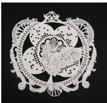
Vinz.. Dessain mis en échec Ensemble de quatre dessins La patiente (sérigraphie sur bois) La chance (papier découpé) Le rapport de force (sérigraphie sur bois) le jugement (papier découpé) photo : la chance