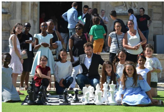
A St Maur