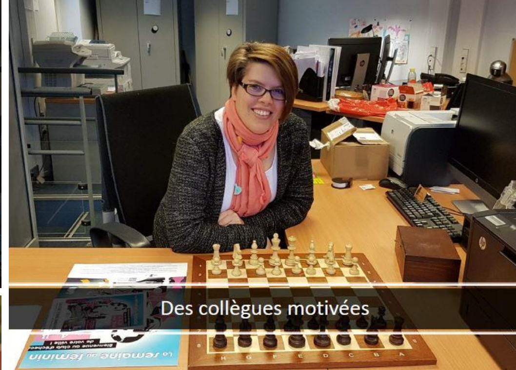
Des collègues motivées