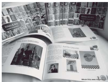
Guide de l'exposition