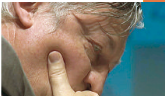
Anatoly Karpov, candidat à la présidence de la FIDE

Dans des régions où est développée une stratégie de masse, le pourcentage des moins de 2000 est de l'ordre de 90 % Imaginez l'impact au niveau international, il y aurait, tout bonnement, 400 000 classés FIDE supplémentaires ! ■