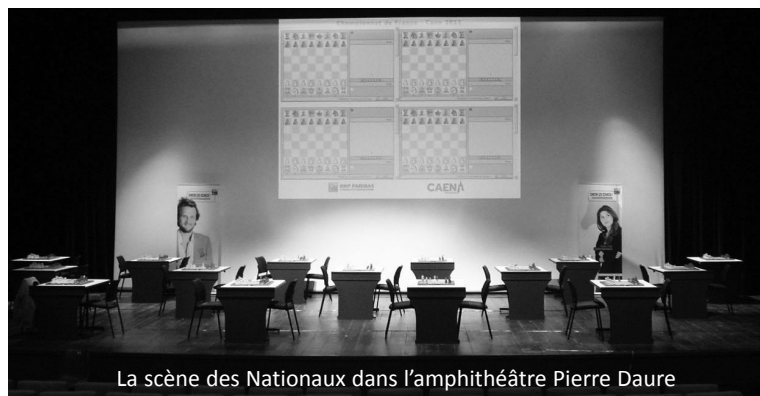
La scène des Nationaux dans l'amphithéâtre Pierre Daure