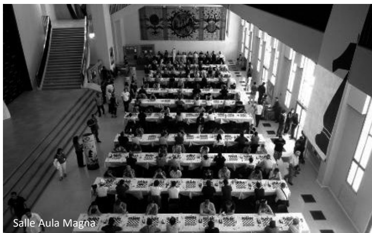
Salle Aula Magna

747 participants ont répondu à l'appel de la Cité de Guillaume le Conquérant. Les Nationaux dans l'ampithéâtre Pierre Daure, les opens dans la salle Aula Magna et la galerie vitrée, lieux propices à la réflexion puisqu'ils servent de salles d'examen. Les voici partis pour 12 jours de compétition, de retrouvailles amicales ou de flânerie dans la ville.