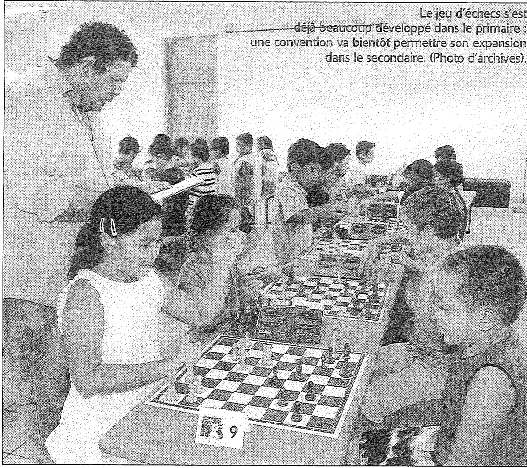
Le jeu d'échecs s'est déjà beaucoup développé dans le primaire : une convention va bientôt permettre son expansion dans le secondaire. (Photo d'archives).

■ Cette reconnaissance permettra à la DES de promouvoir les clubs d'échecs dans tous les collèges et lycées de Polynésie, et à l'association de former des initiateurs.