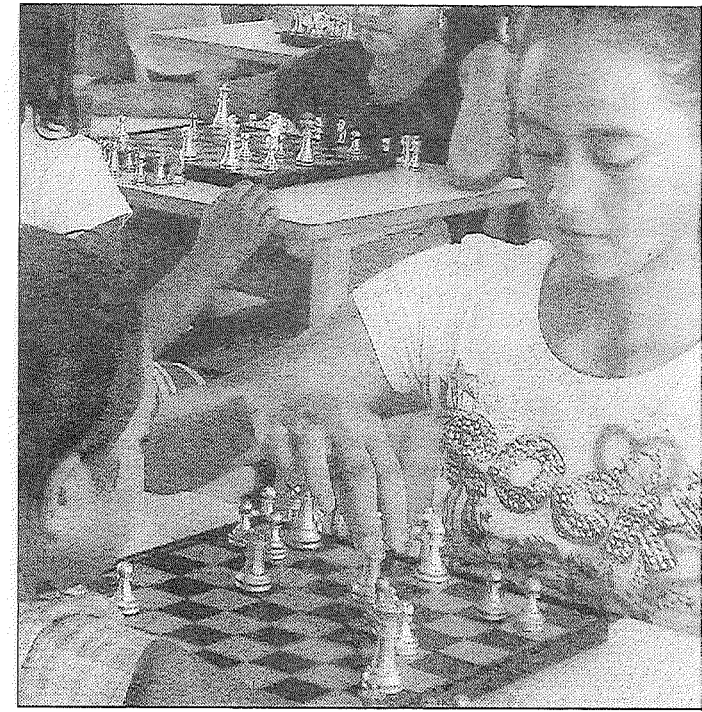
Le jeu d'échecs a été officiellement reconnu comme activité hautement éducative par le ministère de l'éducation nationale.