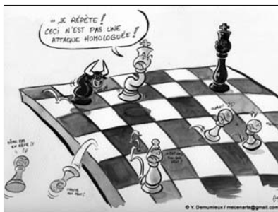
Dessin de Guillaume Néel (Mécèn'Arts)

Les 40 artistes de Mécèn'Arts exposent au profit de l'association " Rêves " qui réalise les rêves d'enfants gravement malades.