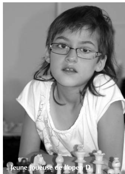
Jeune joueuse de l'open D

Comme il est de tradition à chaque championnat, les jeux, sous-jeux et pendules du championnat seront en vente à la fin de la compétition au stand de la FFE. Pour un meilleur service, vous pouvez passer vos commandes dès aujourd'hui.