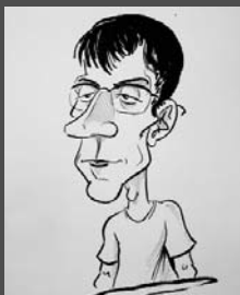
Maxime Vachier- Lagrave

Retrouvez les croquis de Guillaume au stand Mécén'Art