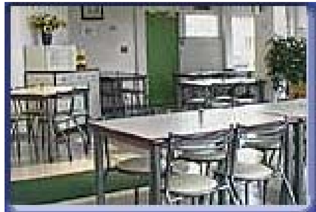
Salle du restaurant

Afin d'être frais et dispo...le lendemain matin, vous pouvez retenir pour le Vendredi soir, 2 Avril. Merci de réserver avant le 26 Mars en téléphonant au 06.70.46.26.47. ou en envoyant un mail à brive.clubechecs@free.fr avec vos noms, prénoms, coordonnées, club d'origine, numéro de licence.